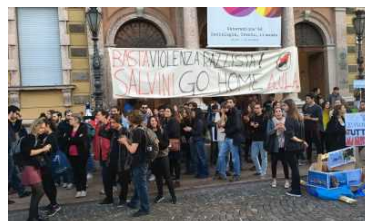
TRENTO / 4 settimane fa Anarchici bloccano il treno, gli studenti tentano l'assalto a Salvini