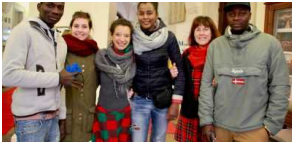
Inaugurata allo Spazio Alpino SAT la mostra "In viaggio 2.0 la creatività sulle rotte dell'immigrazione"