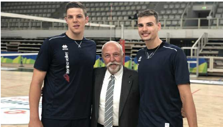
Ufficio Stampa Trento