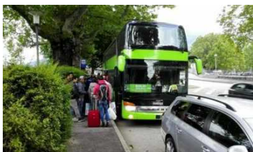
TRENTO / 4 settimane fa Razzismo sul Flixbus a Trento: la bufala smontata dalle telecamere