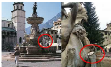
TRENTO / 6 giorni fa Amputato il ginocchio del cavallo della Fontana del Nettuno in Piazza Duomo