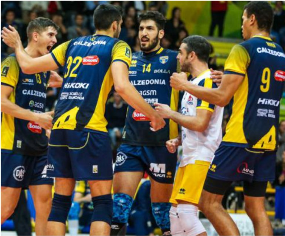
Per Calzedonia oggi il derby dell'Adige contro Trento