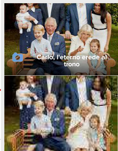
Carlo, l'eterno erede al trono