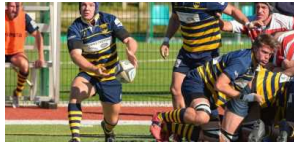
Rugby: Trento nella tana dei Leoni