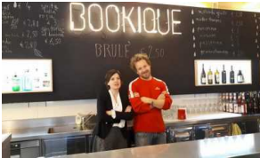
Bookique: fare cultura con i giovani e con la città di Trento