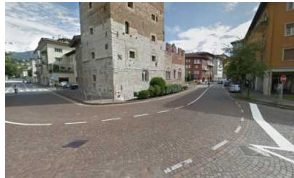
Trento centro: donna inseguita da rapinatori, salva grazie al barista