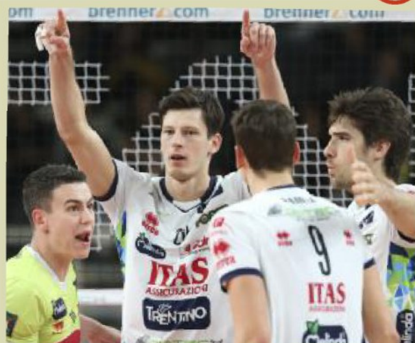
Trento esulta dopo un punto

Itas forte in tutti i reparti Kovacevic fa sempre male