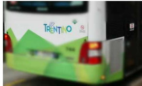
Trento, ancora violenza sui bus: autista scaraventato a terra a Piazza Venezia