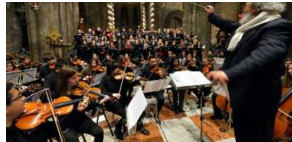
Bonporti: al via «i Martedì del Conservatorio»